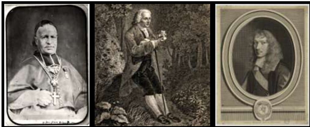
Anonyme , Jean-Pierre Sola, évêque de Nice, repro. ca 1960, 17 x 12 cm (EST.1864) Frilley Jean-Jacques , J. J. Rousseau, 1825, gravure à l'eau-forte, 9 x 6,5 cm (Portrait Rousseau) Nanteuil Robert , Basil Fouquet, frère du surintendant, 1658, burin, 32,5 x 25 cm (Portrait Fouquet-Nanteuil 31)

Environ 4 000 affiches, dont la plus grande partie est constituée des affiches informatives de la ville de Nice. Le fonds des affiches patrimoniales contient les plus grands noms d'artistes : Toulouse Lautrec, Bonnard, Chagall, Matisse... en tout plus de 800 affiches de graphistes et d'artistes de toutes époques et de tous courants artistiques. Parmi ces affiches de graphistes, on retiendra les affiches de Jules Chéret, les affiches publicitaires de romans-feuilletons comme la très célèbre « à l'échafaud » de Lautrec ou « la revue blanche » de Bonnard. Ainsi qu'un très bel ensemble d'affiches de réclame sur la région ou sur la thématique des navires.