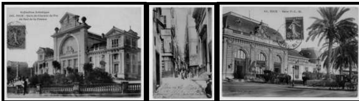
Edition Giletta Nice , Collection Artistique, 101 Nice-Gare du Chemin de Fer du Sud de la France, [19..], carte postale, 9 x 14 cm (CP 105) Edition Picard Nice , 40. Nice. Vieille ville : rue Droite, [19..], carte postale, 14 x 9 cm (CP 631) Edition Giletta Nice , 62. Nice Gare PLM, [19..], carte postale, 9 x 14 cm (CP 572)

Les images comptent environ 10 000 documents dont 6 000 cartes postales et 700 chromos publicitaires. Les cartes et plans comptent environ 1 000 plans récents (IGN) et 200 plans anciens principalement du XVIIIème siècle. La région est bien représentée (Contea di Nizza, carte manuscrite de Villefranche...). Ces documents sont en cours d'inventaire et pour le moment peu représentés sur le catalogue.