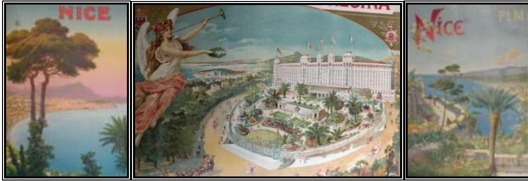
Anonyme , Nice PLM : trains extra-rapides de jour ou de nuit, [ca 19..], affiche 107 x 78 cm (EST.2885) Tamagno Nicolas , Excelsior Hôtel Régina, [ca 1890], affiche 110 x 92 cm (EST.5103) Tanconville , Nice [vue du château] P.L.M. billets à prix réduits, ca 1899, affiche 103 x 73 cm (EST.2829)

Environ 4 000 affiches, dont la plus grande partie est constituée des affiches informatives de la ville de Nice. Le fonds des affiches patrimoniales contient les plus grands noms d'artistes : Toulouse Lautrec, Bonnard, Chagall, Matisse... en tout plus de 800 affiches de graphistes et d'artistes de toutes époques et de tous courants artistiques. Parmi ces affiches de graphistes, on retiendra les affiches de Jules Chéret, les affiches publicitaires de romans-feuilletons comme la très célèbre « à l'échafaud » de Lautrec ou « la revue blanche » de Bonnard. Ainsi qu'un très bel ensemble d'affiches de réclame sur la région ou sur la thématique des navires.