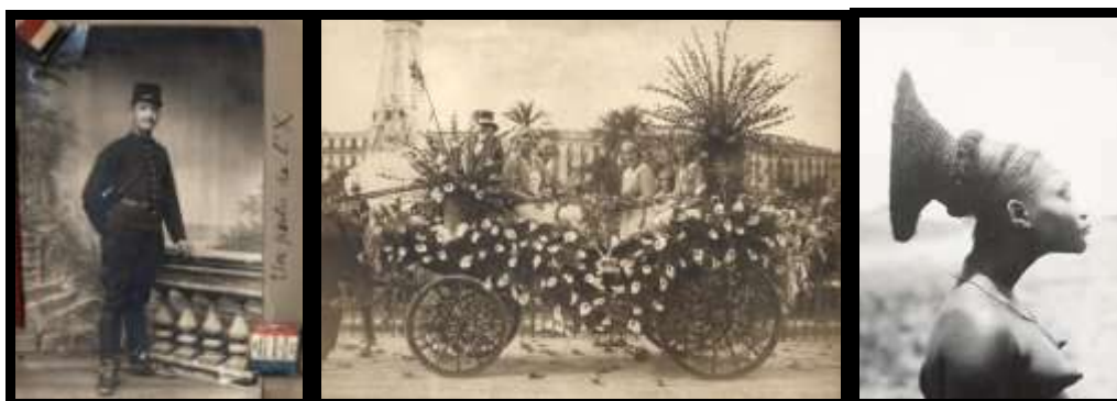
Anonyme , Photographe : poilu de l'x, photographie, 14 x 9 cm (PHO.83) Sadi Photo. Nice , Le char du Tennis Club, photographie, 13 x 18 cm (PHO.365) Anonyme , Femme mangbetu, photographie, 18 x 13 cm (PHO.280)

Le fonds photographique regroupe des collections très riches : un exceptionnel lot de photographies inédites sur la Croisière noire de 1923, une centaine de photographies début de siècle (don de Mme Gallibert 1976) représentant des vues de nombreux pays d'Afrique du Nord, d'Egypte, d'Espagne, d'Indochine, de Grèce, et aussi des photographies aériennes de nombreuses régions françaises et de la Libération de Paris ; mais aussi quelques photographies intimistes de Victor Hugo et sa famille (don Guimbaud 1956). Nice et sa région sont fortement représentées depuis 2013 avec l'acquisition de plus de 5 000 tirages papiers, négatifs et plaques de verre stéréoscopiques provenant d'un photographe local.