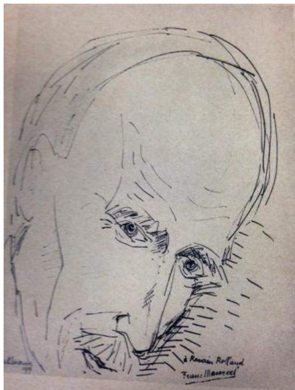
Portrait par Frans Maseerel, frontispice dans Au dessus de la mêlée, Paris, P. Ollendorf, 1915.

Romain Rolland réside en Suisse lors du déclenchement de la première guerre mondiale. Bouleversé face à ce véritable « suicide » européen et n'étant pas mobilisable du fait de son âge (48 ans), il décide de ne pas quitter ce pays. Outre son engagement au sein de la Croix-Rouge, basée à Genève, il demeure aussi en Suisse afin de pouvoir librement diffuser ses œuvres. Il tente aussi de maintenir des liens avec des intellectuels allemands et autrichiens, et se lie également avec des exilés russes (dont Lénine).