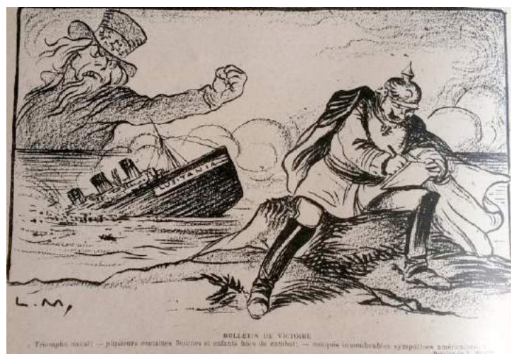
Dessin dans Le Rire Rouge , 22 mai 1915, BMVR. Bib. Romain Gary (Res. P.504 )