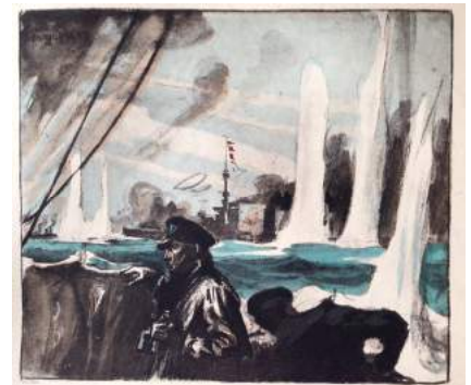
« La guerre navale racontée par nos amiraux », Paris, Librairie Schwarz, 1927. BMVR de Nice. Bibliothèque Romain Gary,

Bien que l'Allemagne revendique la victoire, sa flotte de haute-mer n'est plus en mesure d'affronter la Royal Navy. Les Allemands se lancent dans une guerre sous-marine à outrance qui à terme, conduira les Etats-Unis à entrer en guerre.